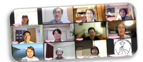
桐生キリスト教会 オンライン