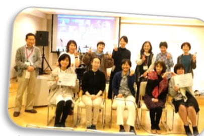
シティビジョン・グローリーチャーチ