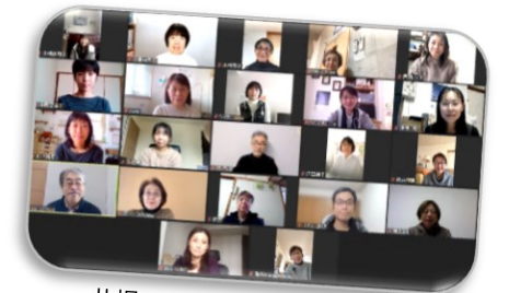
札幌スクール オンライン平日