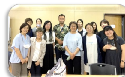
熊本ハーベストチャーチ