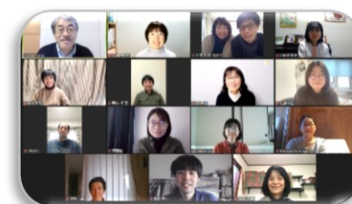
札幌スクール オンライン土日